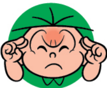
Dor de cabeça

Vômitos e diarreia podem ocorrer em até 57% dos casos, dependendo da idade. Elas também podem apresentar respiração acelerada e chiado no peito. Crianças com sintomas de resfriado ou com vômitos e diarreia não devem ir para a escola.