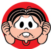
Dor de ouvido

Os sintomas mais comuns de covid-19 que as crianças apresentam são os de um resfriado, como febre, coriza, dor de ouvido, dor de garganta e dor de cabeça .