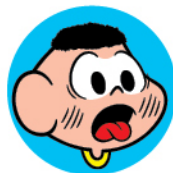
Dor de garganta

Os sintomas mais comuns de covid-19 que as crianças apresentam são os de um resfriado, como febre, coriza, dor de ouvido, dor de garganta e dor de cabeça .