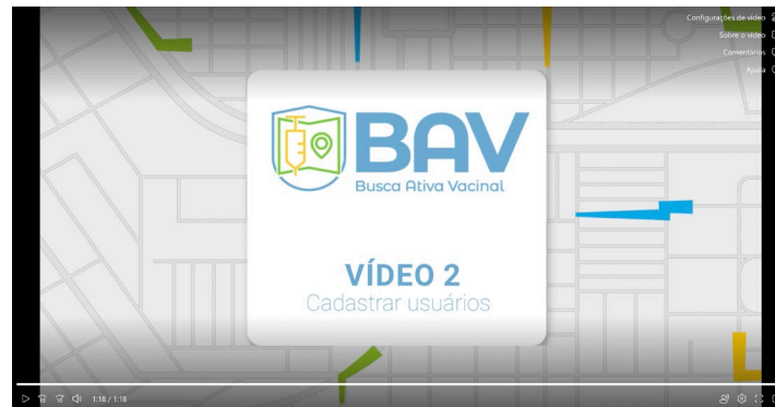
Tutorial - Cadastro de usuário na BAV