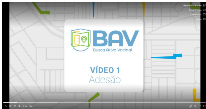
Tutorial - Adesão Plataforma BAV